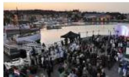
Invigning av muddringen, september 2016.

Hösten 2016 inleddes muddringen med en invigning och närmare 500 oskarshamnsbor fanns på plats för att fira att vi äntligen är igång. Stort tack till alla er som deltog! Efter provmuddring under september och början av oktober kom muddringen igång på helfart. Muddringen pågick fram till mitten av november då snö och kyla gjorde sitt inträde.