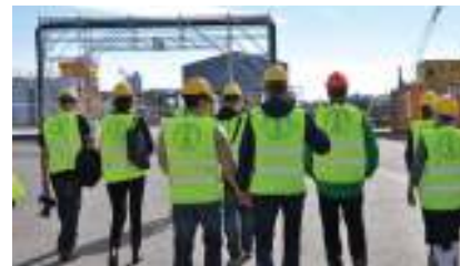
Studiebesök, september 2016.