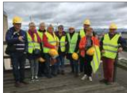
Studiebesök hösten 2017.

Vilka är besökarna? Besöken som kommer är från skolor, föreningar, företag, politiker, myndigheter, kommuner, fackföreningar med flera, alla som vill lära mer om projektet är välkomna.