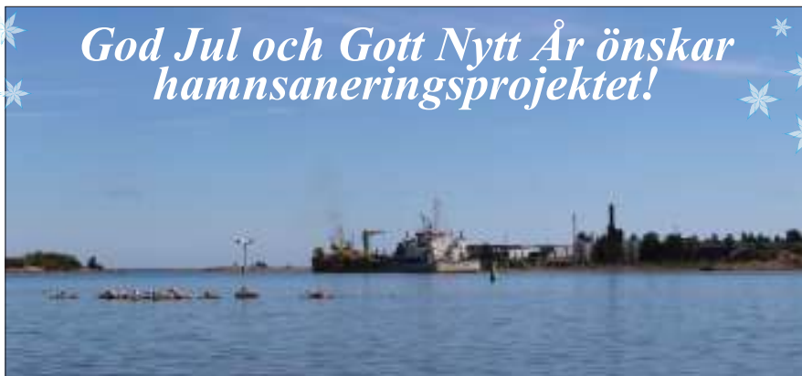
Mudderverket Pinta muddrar utanför Mänskensviken.

God Jul och Gott Nytt År önskar hamnsaneringsprojektet!