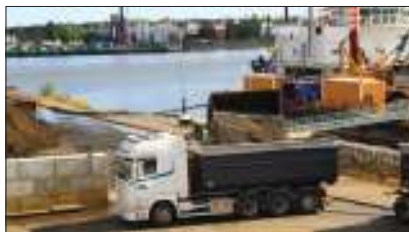
Lastning av muddermassor för transport till deponi.

Nu börjar deponin i Storskogen att ta form. Deponin växer fram från ena kanten.