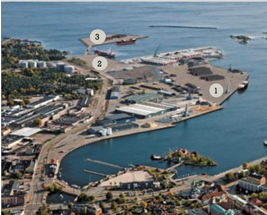
Planerade fyllnadsområden i hamnen, 1: Rävänäset, 2:Oljehamnen, 3: Grimskallen. Modellering: Prinforbergs

Nyhetsbrev 4 - Mars 2011 - Ansvarig utgivare: Kaj Nilsson